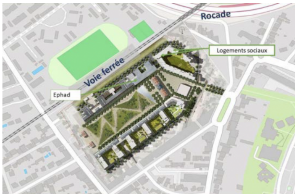
Figure 2: Population vulnérables et expositions aux nuisances sonores et à la pollution routière : exemple d'un projet d'aménagement

Enfin, inclure les ISS dans l'aménagement aujourd'hui, c'est aussi prévenir les effets néfastes du changement climatique sur la santé de demain. Il est évident que toutes les populations ne disposeront pas des mêmes moyens pour faire face aux effets du réchauffement climatique et à ses conséquences sur leur santé.