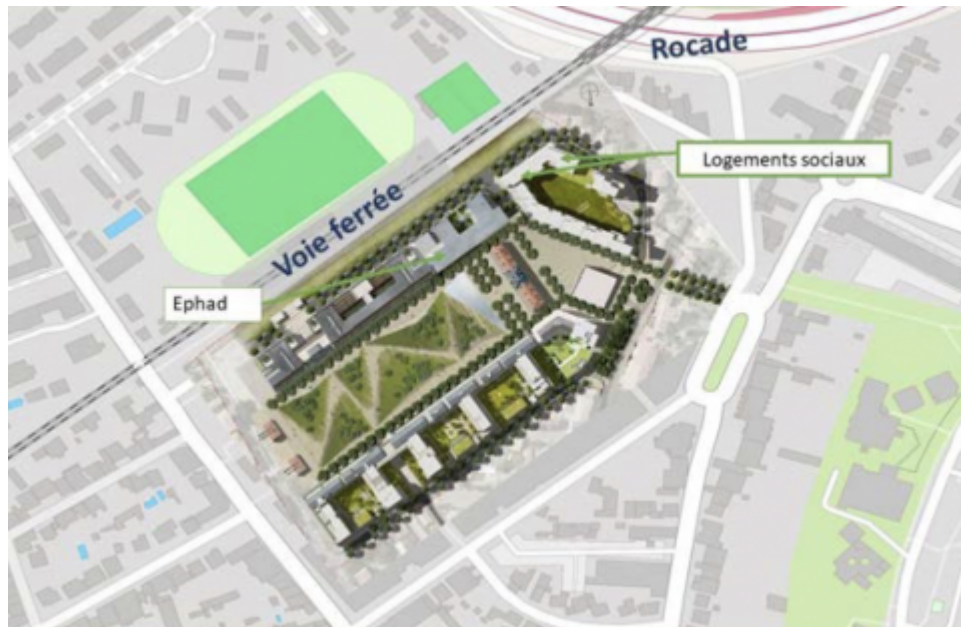
Figure 2: Population vulnérables et expositions aux nuisances sonores et à la pollution routière : exemple d'un projet d'aménagement

Enfin, inclure les ISS dans l'aménagement aujourd'hui, c'est aussi prévenir les effets néfastes du changement climatique sur la santé de demain. Il est évident que toutes les populations ne disposeront pas des mêmes moyens pour faire face aux effets du réchauffement climatique et à ses conséquences sur leur santé.