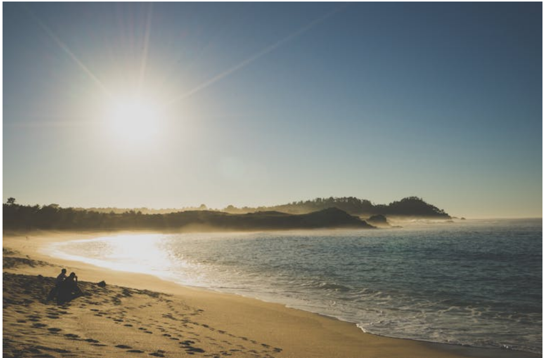
Le bain de nature, une solution à bien des maux.

Le journaliste américain Richard Louv, lui, parle de « trouble de déficience en nature » ( nature-deficit disorder ), et dénonce la tendance croissante des jeunes générations à passer plus de temps enfermées devant des écrans, que dehors à découvrir leur environnement naturel. Alors que la consommation d'anxiolytiques, de somnifères et d'antidépresseurs ne cesse d'augmenter pour palier à l'anxiété et au stress quotidiens, il se pourrait bien que le mal moderne soit un manque de nature.