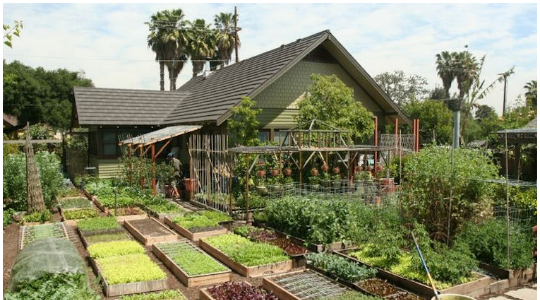
La ferme de Jules Dervaes à Los Angeles.

La notion de nature comme remède aux maux de la civilisation n'est pas nouvelle. Les exemples de retour à la nature en réaction à un contexte urbain et/ou industrialisé abondent, depuis l'Antiquité jusqu'aux expériences actuelles de fermes urbaines et d' écovillages , en passant par le mouvement transcendantaliste et la période contre-culturelle .