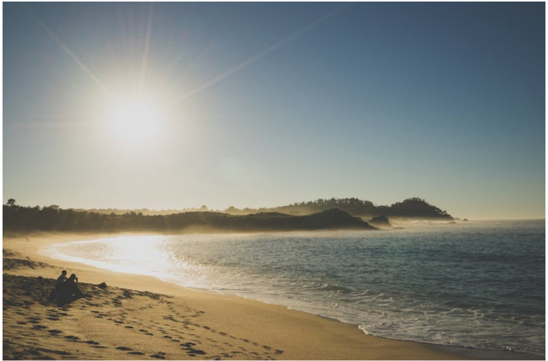
Le bain de nature, une solution à bien des maux.

Le journaliste américain Richard Louv, lui, parle de « trouble de déficience en nature » ( nature-deficit disorder ), et dénonce la tendance croissante des jeunes générations à passer plus de temps enfermées devant des écrans, que dehors à découvrir leur environnement naturel. Alors que la consommation d'anxiolytiques, de somnifères et d'antidépresseurs ne cesse d'augmenter pour palier à l'anxiété et au stress quotidiens, il se pourrait bien que le mal moderne soit un manque de nature.