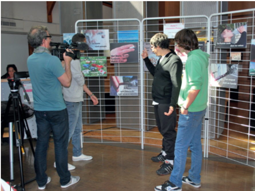
Journée P2P, la santé par les pairs, Epidaure, avril 2014.

développée en concertation avec les principaux acteurs, les professionnels, et les groupes nommés comme pairs éducateurs (figure ci-contre). Cette démarche impose donc la construction d'une dynamique relationnelle qui s'éloigne de l'intervention habituelle : c'est une démarche participative impliquant une co-construction entre les professionnels et les pairs éducateurs.