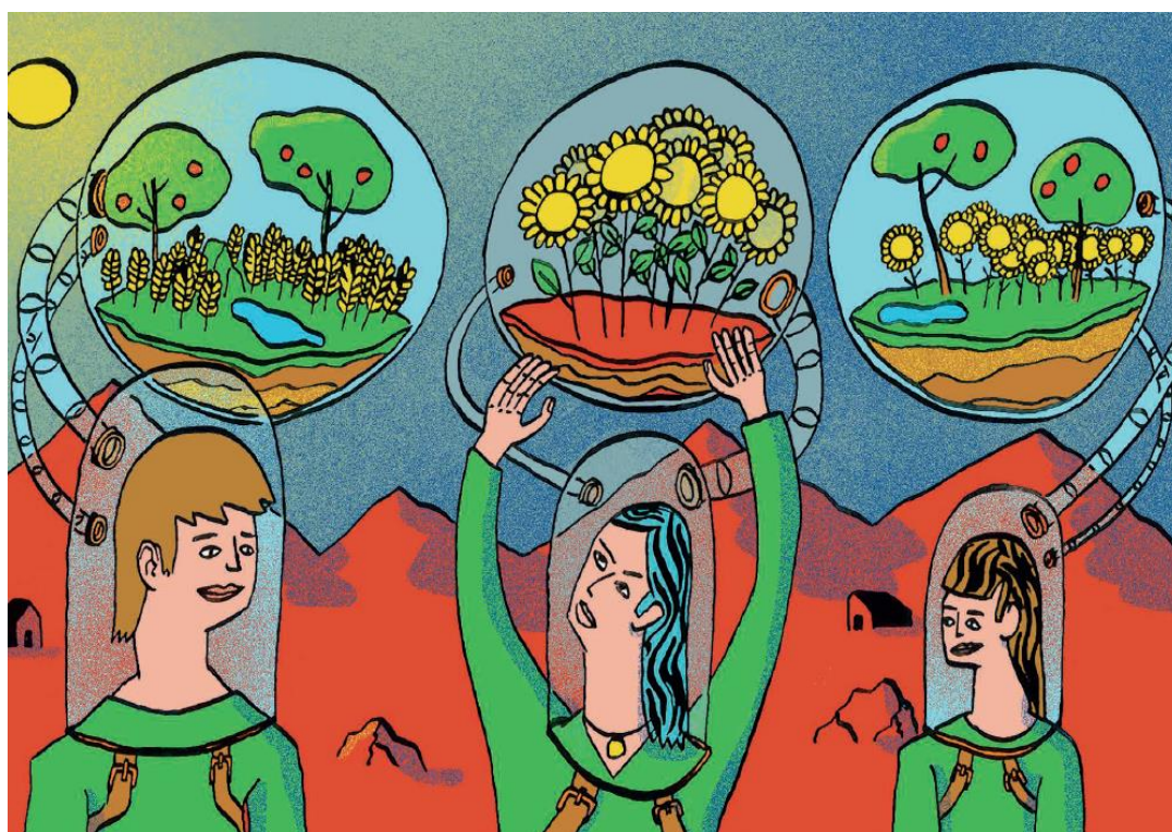
Carte postale créée par les jeunes : la qualité de l'air en lien avec les pratiques agricoles durables

Un moment de débriefing avec le référent jeunesse permet au groupe d'analyser les données recueillies et d'en prioriser une thématique. Les jeunes passent alors une commande à un artisan d'art du territoire : ce dernier doit illustrer la thématique principale en santé-environnement sur un support artistique (Carte postale, affiche...). Le support est ensuite communiqué aux habitants et visiteurs du territoire.