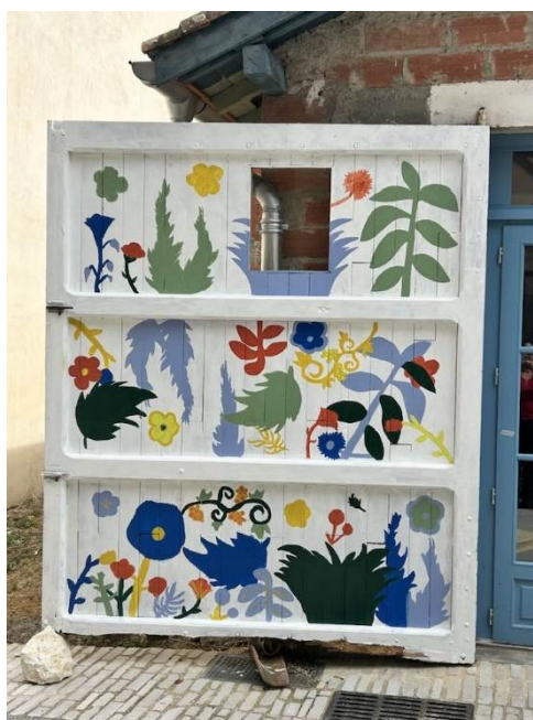
Fresque créée par les jeunes en art urbain : flore estivale dans les villages du territoire

Mme Hélène BOURY, chargée de coopération territoriale cooperationterritoriale@ccb132.fr 06.62.50.82.95