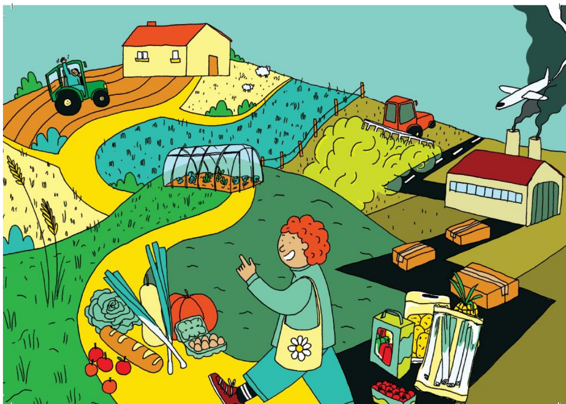
Carte postale créée par les jeunes : le rôle du consommateur acteur en SE