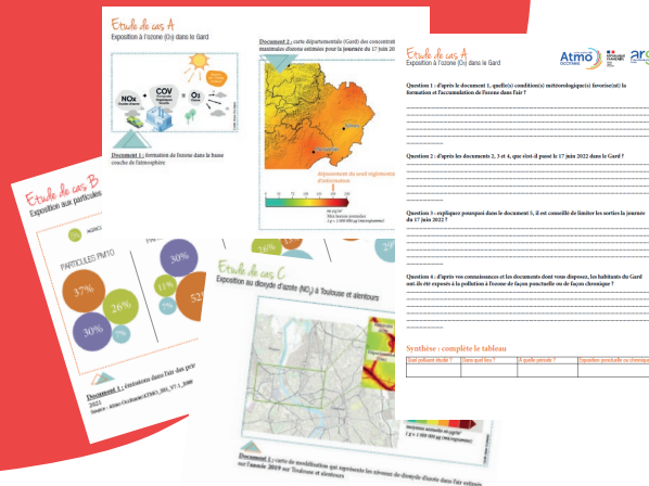
Etude de documents en groupe

Cet atelier se clôture avec l'activité Comment agir ? qui propose aux élèves, pour des situations-typiques de réfléchir à des alternatives dans les déplacements et dans les moyens de chauffage utilisés, pour moins polluer l'air.