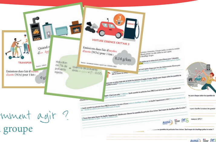
Comment agir ? en groupe