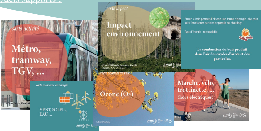
Panorama de l'air en groupe